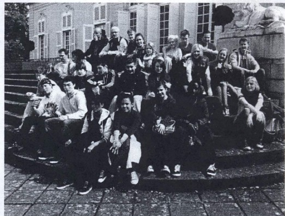
Hela gänget på plats.